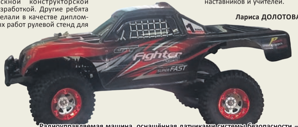
Радиоуправляемая машина, оснащённая датчиками системы безопасности — дипломная работа выпускников преподавателя 1 категории Михаила Наумова